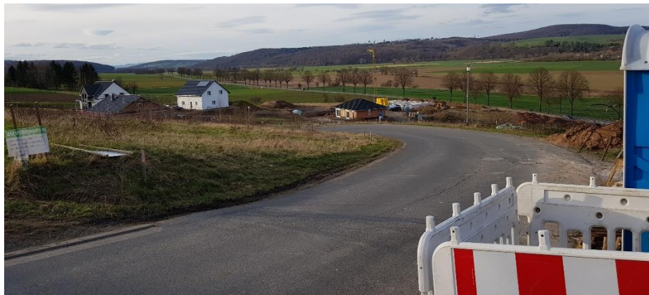
Bebauungsaktivitäten am „Schiefer Berg“ in Katlenburg

Doch nun ist auch dort Bautätigkeit erkennbar. Acht Grundstücke werden aktuell bereits bebaut, auf vier weiteren laufen Planungen. Diese Entwicklung ist für unsere Ortschaft sehr erfreulich und gewährleistet, da einige echte Zuzüge aus anderen Gemeinden dabei sein werden, auf mittlere Sicht konstante Einwohnerzahlen in Katlenburg.